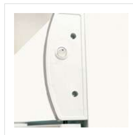
Punto de luz interior y caja de luz exterior

Dimensiones (anchoxaltoxfondo) 460x980x500mm Peso..... 39 Kg Capacidad..... 80 litros Refrigerante..... R134a Rango temperatura..... 3°C/ 10°C Tensión..... 220 V/ 50Hz