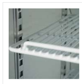
Bandejas ajustables. Rejillas de aluminio con pintura plástica.