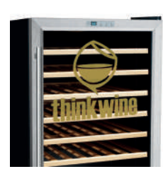
Posibilidad de personalizar la puerta a gusto del cliente