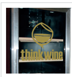
Posibilidad de personalizar la puerta a gusto del cliente