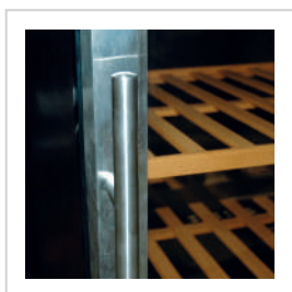
Marco de acero inoxidable