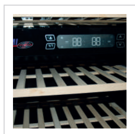
Termostato digital con una o dos temperaturas