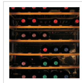
Baldas fijas de madera